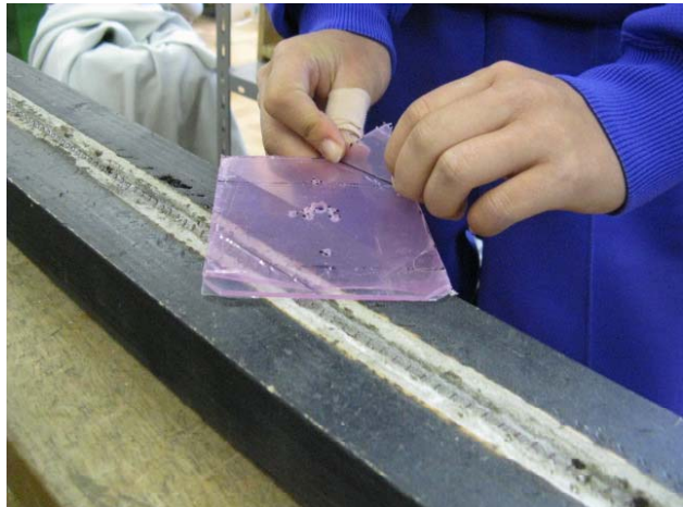
<アクリル曲げ器による曲げ>